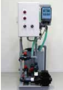
スターサポーターAM-BO1型