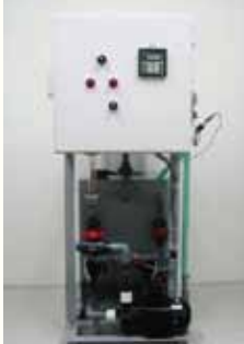
スターサポーターAM-PO1型